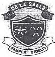
De La Salle School